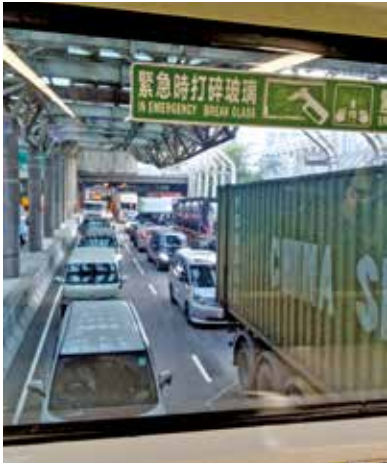
屯赤隧道開通後，往機場方向交通更見阻塞。