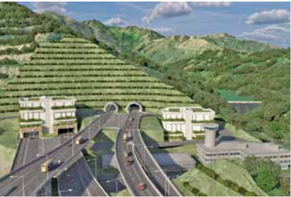
多名候選人提及加快興建屯門繞道。（概念圖）