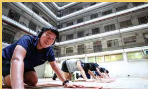
「樓下精神」計劃，將音樂與運動帶入公共屋邨。

回想疫情爆發不久後，「體育係」推出「樓下精神」計劃，走入公共屋邨，以 Silent Disco 形式，帶領居民戴着耳機在公共空間運動。「當時大家困喺屋企，我哋諗住將運動帶返落地。」