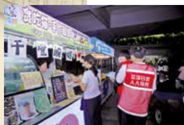
深圳有夜市推行垃圾分類活動，提升檔主及遊人的垃圾分類知識。

根據環境局的《香港資源循環藍圖2035》，中期目標包括把都市固體廢物的人均棄置量逐步減少40至45%，回收率提升至約55%等。為此，環保署擴展「智能回收系統先導計劃」，並持續擴充「綠在區區」上門回收服務等。由於香港在大力推動家居回收，本港地道的旅遊熱點鮮見回收分類箱。