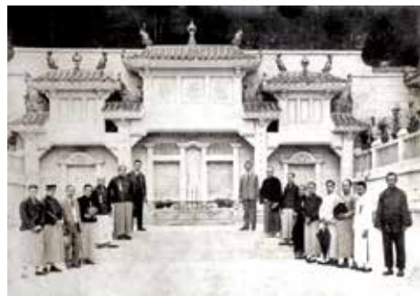
公墓1922年在大球場後山的掃桿埔設立。

雖然該墳場沒有正式的入口，但仍可在大球場後方的樓梯，或由樂活道樂景園旁邊的樓梯前往。另外原位於加路連山下的平房區，包括舊日的正民村及衛斯理村，亦於2001年被清拆。