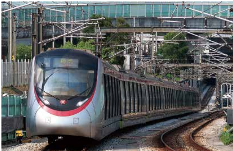
隨北都發展，屯馬線難上車問題勢將惡化。