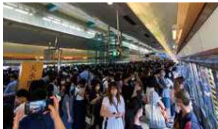
天水圍站經常出現月台迫爆情況。