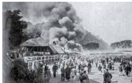
1918年馬場大火，屬本港死傷最嚴重火災。

1918年跑馬地馬場發生大火，導致逾600人死亡。當時的東華醫院負責賑災，並協助申請用地將死難者永久安葬，最終於1922年在香港銅鑼灣掃桿埔的加路連山墳場附近設立「戊午馬棚遇難中西士女之墓」，並興建「馬棚先難友紀念碑」。紀念碑設有牌樓、化寶塔及涼亭，設計糅合西方古典建築與傳統中式建築的元素。