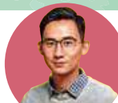
作者： 陳洛志 醫師