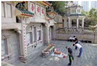
每年清明，東華三院派員前往紀念碑掃墓。