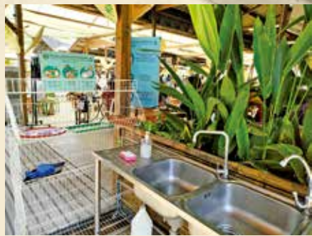
清邁市集內設有清洗餐具的設備。