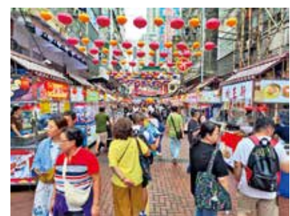
廟街是遊客的熱門景點，但未見回收箱設備。

《我家》記者日前在旅遊熱點包括旺角花園街、女人街及油麻地廟街察看，發現在街頭巷尾都找不到分類回收箱的蹤影，只有見到滿滿的垃圾桶待清理。由於該處是旅遊熱點，大部分垃圾都是空膠樽，外賣小食紙兜及膠袋等。當記者問市民及遊客是否見到有回收箱時，他們都不約而同說：「不見呀，垃圾桶就有。」