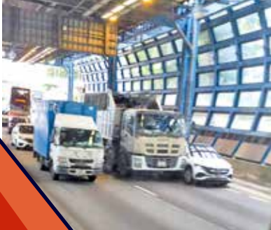
皇珠路車速限制降低後，仍屢現交通意外。