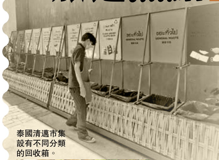
泰國清邁市集設有不同分類的回收箱。