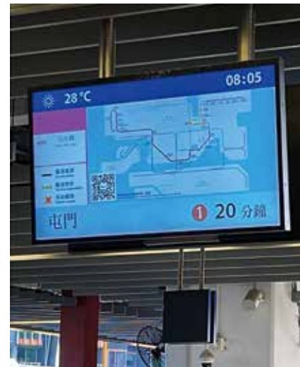
屯馬線過去曾發事故，令行車嚴重延誤。

屯馬線載客量飽和，居民長期面對繁忙時間元朗、天水圍站難上車問題。未來北部都會區大力發展，錦上路住宅入伙，聯同北環線、屯門南延線及港深西部鐵路引流，屯馬線載客量有增無減，「上唔到車」問題將更見惡化。新一屆立法會選舉投票日將於12月7日舉行，新界北選情競爭激烈，五名區議員爭奪當區兩個地方選區議席，各候選人為此出謀劃策，提出建議冀盡快作出改善。