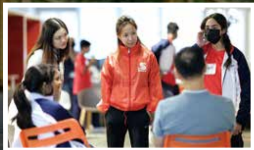
體育有助打開對話，建設溝通橋樑。

她笑說：「我成日覺得自己唔係做運動嘅人，我係用運動做人。」這句話，也正好總結了她一路走來的信念——讓體育不止是一場比賽，而是一場屬於所有人的人生運動。