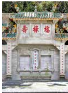
紀念碑設有牌樓、化寶塔及涼亭。

加路連山墳場又名咖啡園墳場，是由於有外國商人曾在19世紀中期，於掃桿埔開闢咖啡豆種植場而得名。惟經嘗試後發現本港氣候，並不宜種植咖啡豆，咖啡園亦隨之結束，並在20世紀初前後開始成為墓葬區，墳場範圍亦豎立起界石為記，當中以一個豎在山崗岩石上的第16號界石最為人熟知。