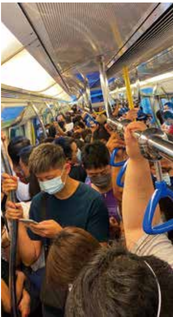
載客量飽和，乘客在車廂裏想伸展都難。