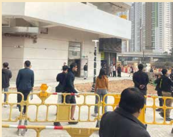
居民收鎖匙後，密鑼緊鼓安排並展開裝修。