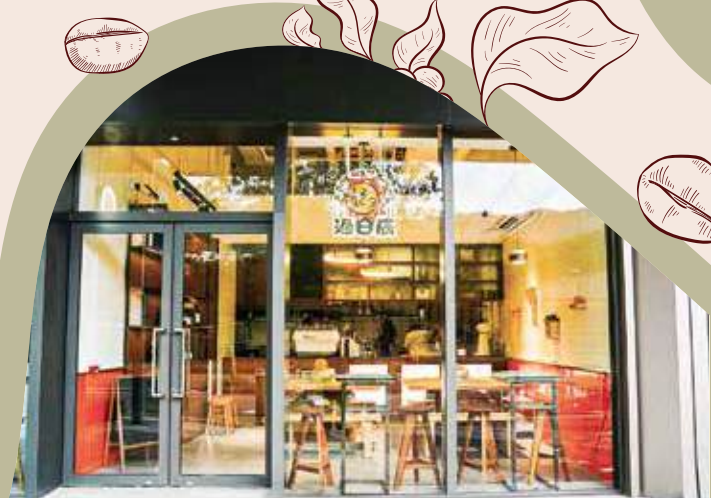
在白石角這個新社區，居民有個停下來角落。