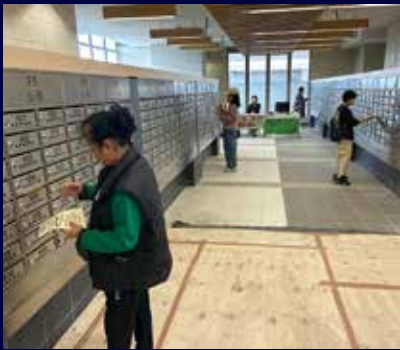
義工透過入信箱提醒住戶不要聘用黑工。