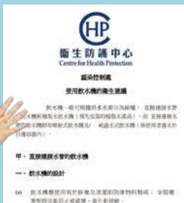
衛生防護中心設有安裝飲水機的地點建議。