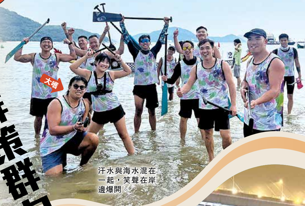
汗水與海水混在一起，笑聲在岸邊爆開。