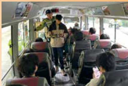
警方過去會在小巴上檢控乘客無扣上安全帶。