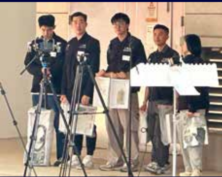
入境處1月15日展開反非法勞工行動。