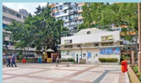
新蒲崗仁愛街遊樂場裝水機，亦設在洗手間外。

飲水機的出水口也易受污染。她稱曾在其他地方見到有飲水機安裝在抽風機附近位置，亦有感欠衛生。她表示，當局可加強宣傳教育，籲遊人勿在該處吐痰及洗杯等。