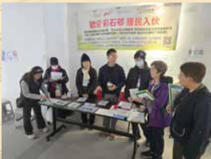
支援計劃「彩石友里」於彩石邨入伙時啟動。