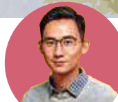
作者： 陳洛志 醫師