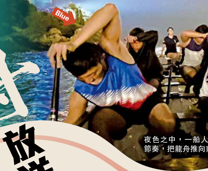
夜色之中，一船人節奏，把龍舟推向...