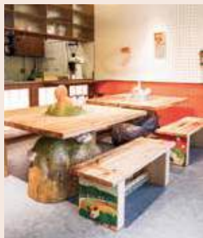
店內放有由本地樟木雕刻而成的長桌。