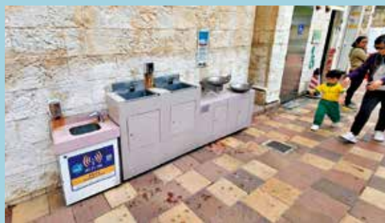
佐敦谷公園洗手間外放置裝水機。

粵車南下正式開始，料吸引更多內地一家大細的旅客來港深度遊。除了遊覽郊野公園及橫街小巷，不少內地旅客會在公園「放娃」，貼地感受香港城市面貌，情況就如深圳人才公園及龍華公園，成為港人家長北上熱門地。不過，《我家》記者發現本港部分旅遊熱點的公園衛生欠奉，有些即使是重新修繕及增加新設備，惟在設計上略欠周全，有改進空間。