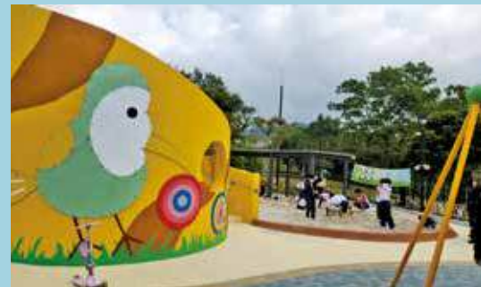
不少孩童到佐敦谷公園耍樂。