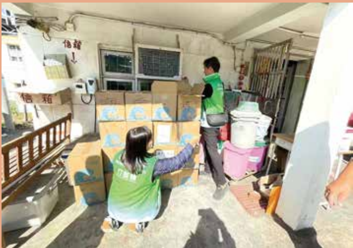
團隊到多個鄉村通知居民換水管停水。

據該會介紹，「彩石友里」計劃未來會舉辦包括社區探訪、鄰里互助網絡搭建、組織興趣班、節日活動及生活資訊支援等多元活動，以促進鄰里聯繫。侯漢碩希望，可以與彩石邨的居民共建一個互助、共融、友愛的新社區。