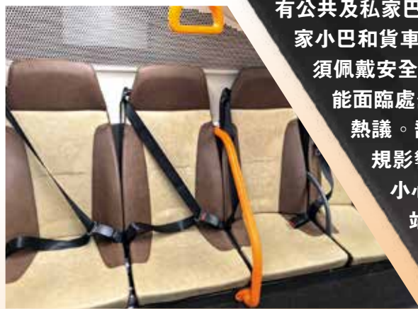
1月25日（周日）起，巴士乘客必須扣上安全帶。