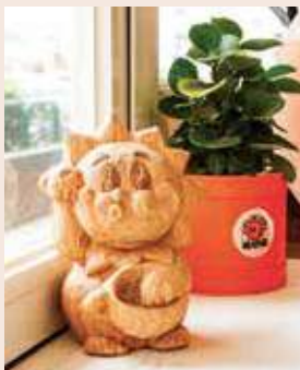
木雕藝術家為「過日辰」製作太陽標誌公仔。

「過日辰」這個名字，源自先有標誌、再有命名的過程。當時朋友畫了一個太陽的圖案，於