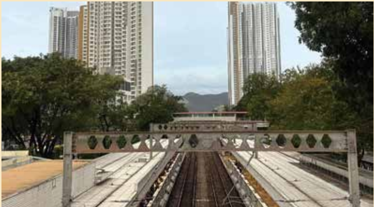
彩石邨與寶石湖邨均鄰近上水港鐵站。