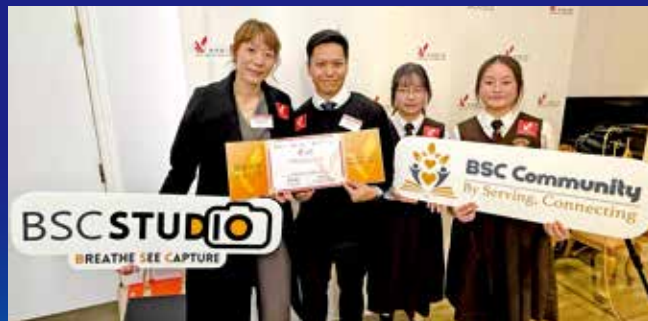
團隊獲得「香港義工獎」的愛心學校獎。

漫畫家、從事多年漫畫及圖書繪本工作，作品有：《數碼暴龍》、《妖怪總動員》、《動夢成真》（中學電影動畫藝術教材—香港生產力促進局製作）、《大偵探福爾摩斯》、《衛斯理系列少年版》、《神探包青天》、《我的吸血鬼同學》、《妙探鬼靈精》、《UBL宇宙當入樽》。