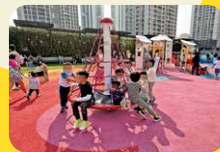
繩網氹氹轉指示不清，同時有多達十名兒童玩耍。