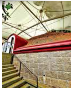
古墓於2005年加設帳篷上蓋作保護。