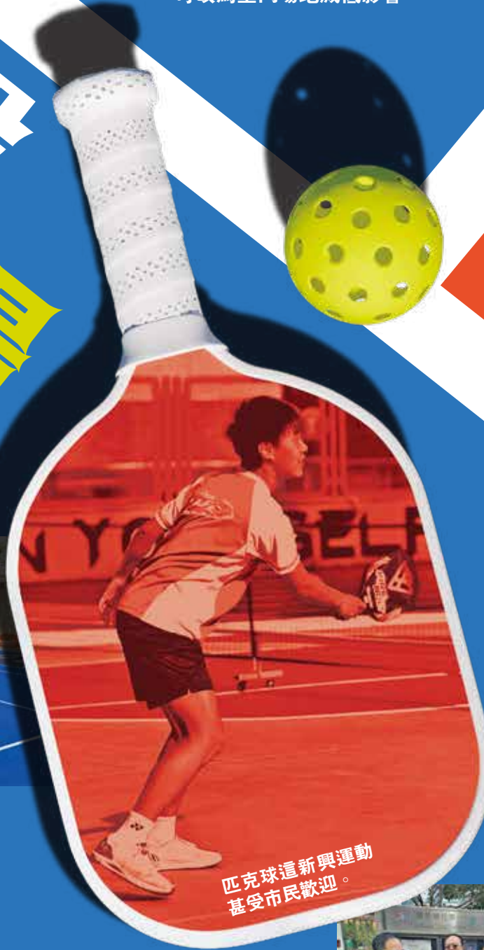
匹克球這新興運動甚受市民歡迎。