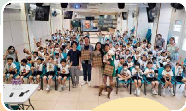
帶毛孩到校園去，讓孩童學懂照顧小生命。