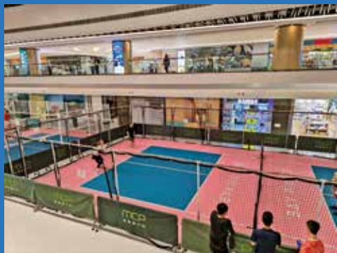
現時將軍澳有商場設室內匹克球場地。