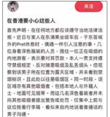
旅客事後在社交平台分享騙徒犯案手法。