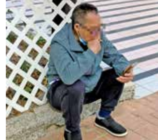
法定禁煙區擴大至指定處所出入口3米範圍，違者或被檢控。

政府宣布，今年4月30日起公眾地方管有另類吸煙產品（包括電子煙煙彈、煙油、加熱煙支及草本煙）將全面禁止。市民在公眾地方吸食或攜帶已啟動的另類煙，即屬違法，可被定額罰款3,000元；管有超額另類煙或作商業用途，最高刑罰為罰款5萬元及監禁6個月。