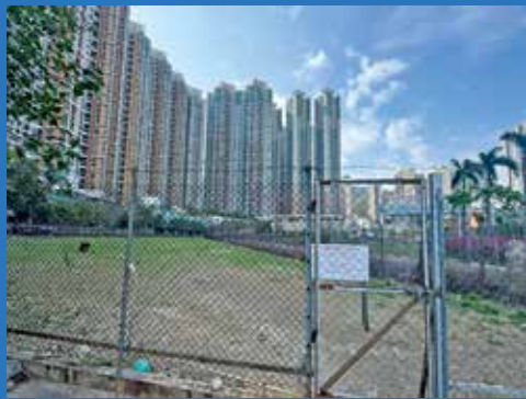
調景嶺公園用地閒置多年，近日政府提出最新安排。

近年新興運動匹克球在本港掀起熱潮，政府早於去年開始，開放指定免費戶外羽毛球場，進行匹克球活動試驗計劃。日前，政府亦公布最快2030年建成的調景嶺公園，並將設有區內首個羽毛球暨匹克球場。惟不少居民擔心匹克球擊球聲浪大，有地區人士冀可改為室內場地減低影響。