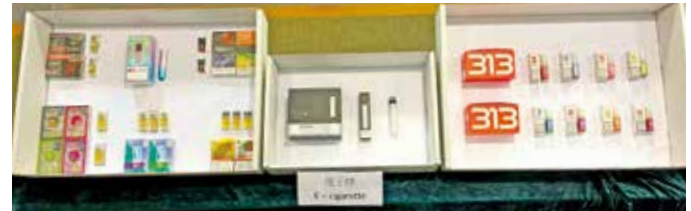
4月底起，公眾地方全面禁止管有另類吸煙產品。（資料圖片）