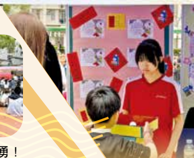
學生有不同崗位，包括攤位揸fit人。