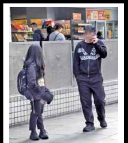
有旅客懷疑在東涌遇到疑似假控煙辦人員執法，拍下騙徒照片存證。

衛生署回覆證實，相關照片所示地方並非法定禁煙區，控煙辦督察亦未有在該地點進行執法工作，就社交平台上指有人涉嫌冒認執法人員，控煙酒辦已通知警方處理。