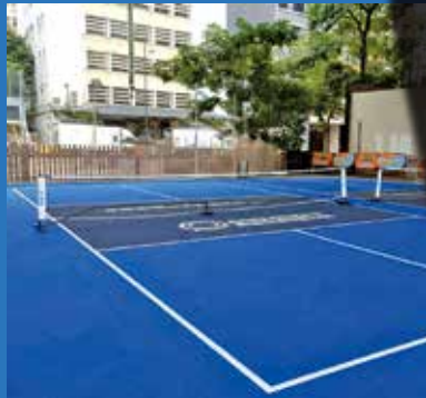
有居民擔心戶外場地會引發噪音滋擾。