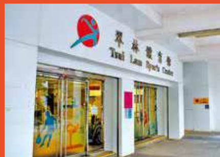
翠林體育館提供匹克球場地。

匹克球 (Pickleball) 是一款集網球、羽毛球與乒乓球特色於一身的新興運動。球員在羽毛球場大小的空間內，揮動較乒乓球拍大的專用球拍，擊打輕巧帶孔的空心球。其門檻極低、節奏適中且安全無虞，因此極受各年齡層喜愛，近年多個匹克球職業聯盟相繼成立，更於2024巴黎奧運獲列入示範項目之一。