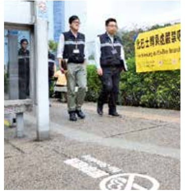
控煙辦人員執法時，會出示證件表明身份。