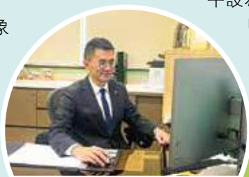
談及教育理念，他不希望學生在壓力下成長。

堂參與，大家一齊慶祝，好似一個真正嘅大家庭。」他笑說，這種由老師主動去「娛樂」學生同家長的安排，正是學校最特別之處——「唔係做一個活動，而係建立關係。」