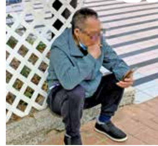
法定禁煙區擴大至指定處所出入口3米範圍，違者或被檢控。

政府宣布，今年4月30日起公眾地方管有另類吸煙產品（包括電子煙煙彈、煙油、加熱煙支及草本煙）將全面禁止。市民在公眾地方吸食或攜帶已啟動的另類煙，即屬違法，可被定額罰款3,000元；管有超額另類煙或作商業用途，最高刑罰為罰款5萬元及監禁6個月。