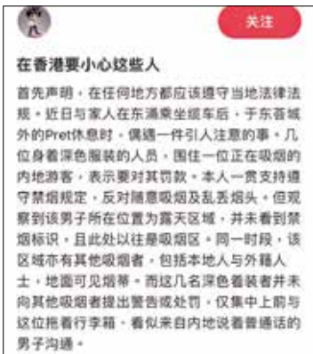
旅客事後在社交平台分享騙徒犯案手法。