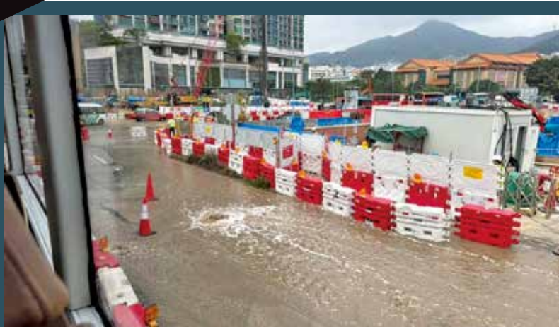
3月21日大涌橋路有水管爆裂。

相關部門隨後封路，進行水管維修及路面重鋪工程。其間，大涌橋路往馬鞍山方向、介乎獅子山隧道公路與沙角街之間全線封閉，多條受影響巴士路線一度需改經沙田市中心道路以避開原有路段，導致該周末沙田正街及担杆莆街一帶車流大幅增加。