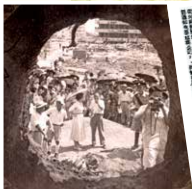
發現古墓起初，曾有工人私下轉售出土文物。