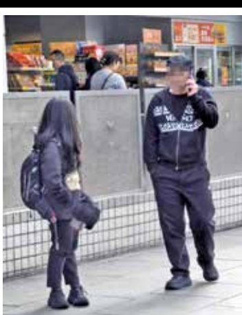
有旅客懷疑在東涌遇到疑似假控煙辦人員執法，拍下騙徒照片存證。

衛生署回覆證實，相關照片所示地方並非法定禁煙區，控煙辦督察亦未有在該地點進行執法工作，就社交平台上指有人涉嫌冒認執法人員，控煙辦已通知警方處理。