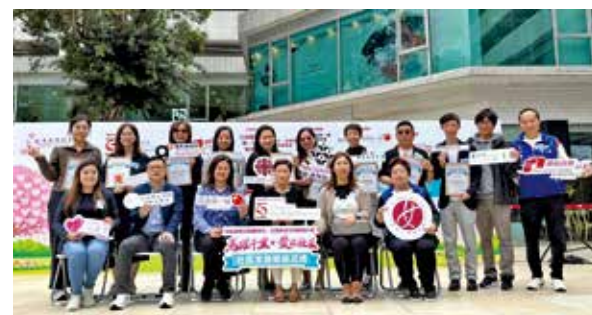
團隊合辦「馬躍千里，愛在社區」活動。

沙田第一城及愉城小區關愛隊3月21日於置富第一城商場外，舉辦「馬躍千里，愛在社區」社區支援網絡巡禮活動，吸引逾2,000名居民參與。