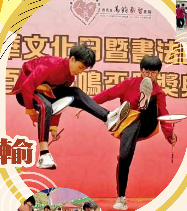
台上表演雜耍，台下喝彩聲不斷。

漫畫家、從事多年漫畫及圖書繪本工作，作品有：《數碼暴龍》、《妖怪總動員》、《動夢成真》（中學電影動畫藝術教材—香港生產力促進局製作）、《大偵探福爾摩斯》、《衛斯理系列少年版》、《神探包青天》、《我的吸血鬼同學》、《妙探鬼靈精》、《UBL宇宙當入樽》。