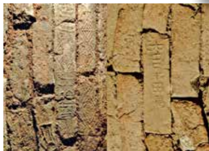
墓磚刻有「大吉番禺」等文字。