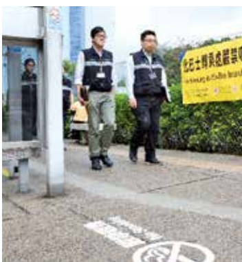
控煙辦人員執法時，會出示證件表明身份。