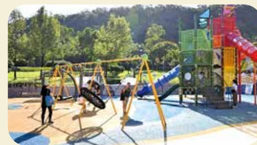
佐敦谷公園兒童遊樂場去年改造完成。

有不願上鏡的家長向記者表示，如每項遊樂設施列明可玩的歲數和人數，大家可依循玩樂，就可讓小孩玩得更放心。