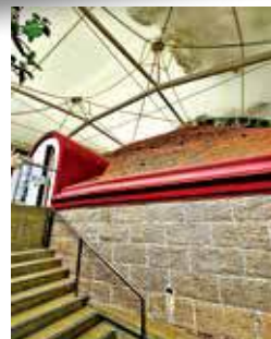
古墓於2005年加設帳篷上蓋作保護。