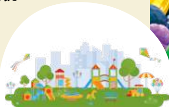
兒童遊樂場系列 ——上——

社會對兒童成長空間愈益重視，近年本港兒童遊樂場不斷引入新元素，而政府於2019年《施政報告》宣布開展改造康文署逾170個公共遊樂空間計劃，當中16項目已完成並開放予公眾使用。今期兒童遊樂場系列的上集報道中，《我家》記者巡視多個區域的兒童遊樂場後發現，遊樂設施比以往更具挑戰性及高難度，惟計劃改造進度緩慢，導致出現有遊樂場無人玩，有遊樂場過於擠迫，使用者分布不平衡。