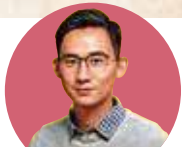
作者： 陳洛志 醫師