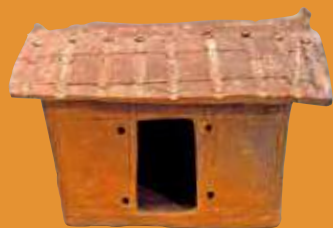
出土的陶製文物，包括建築物模型。

位於九龍深水埗的李鄭屋漢墓，是香港迄今唯一一座經確認的東漢磚室墓。這座擁有近兩千年歷史的古蹟，靜靜座落於鬧市當中，成為研究漢代本港歷史與文化的重要實證。