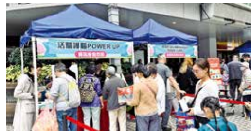
活動吸引大批居民參與。

根據民政事務總署發布的2023至2025年關愛隊服務工作總結報告顯示，第一期關愛隊服務已全部達標完成，部分關愛隊更超越關鍵績效指標服務要求。兩年間全港關愛隊合共探訪約61萬個長者戶及有需要住戶、提供約10萬次簡單家居或支援服務，以及舉辦約5萬項地區活動。