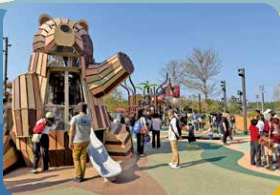
烏溪沙商場遊樂場共有7條滑梯，包括一條5.4米高的長滑梯。

而荃灣廣場內的「空中樂園」兒童遊樂場，《我家》記者巡視時發現除了入口的遊樂規則外，每項設施都有列明每次供多少人玩樂，惟繩網氹氹轉則指示不清，同時有多達十名兒童玩耍，亦不見家長在旁看顧。而搖搖椅列明每次只可一名一至六歲兒童玩耍，但現場就有超過六歲的兒童坐在搖搖椅玩樂。