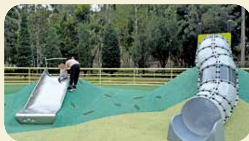
寶翠公園遊樂場有標示設施使用守則。