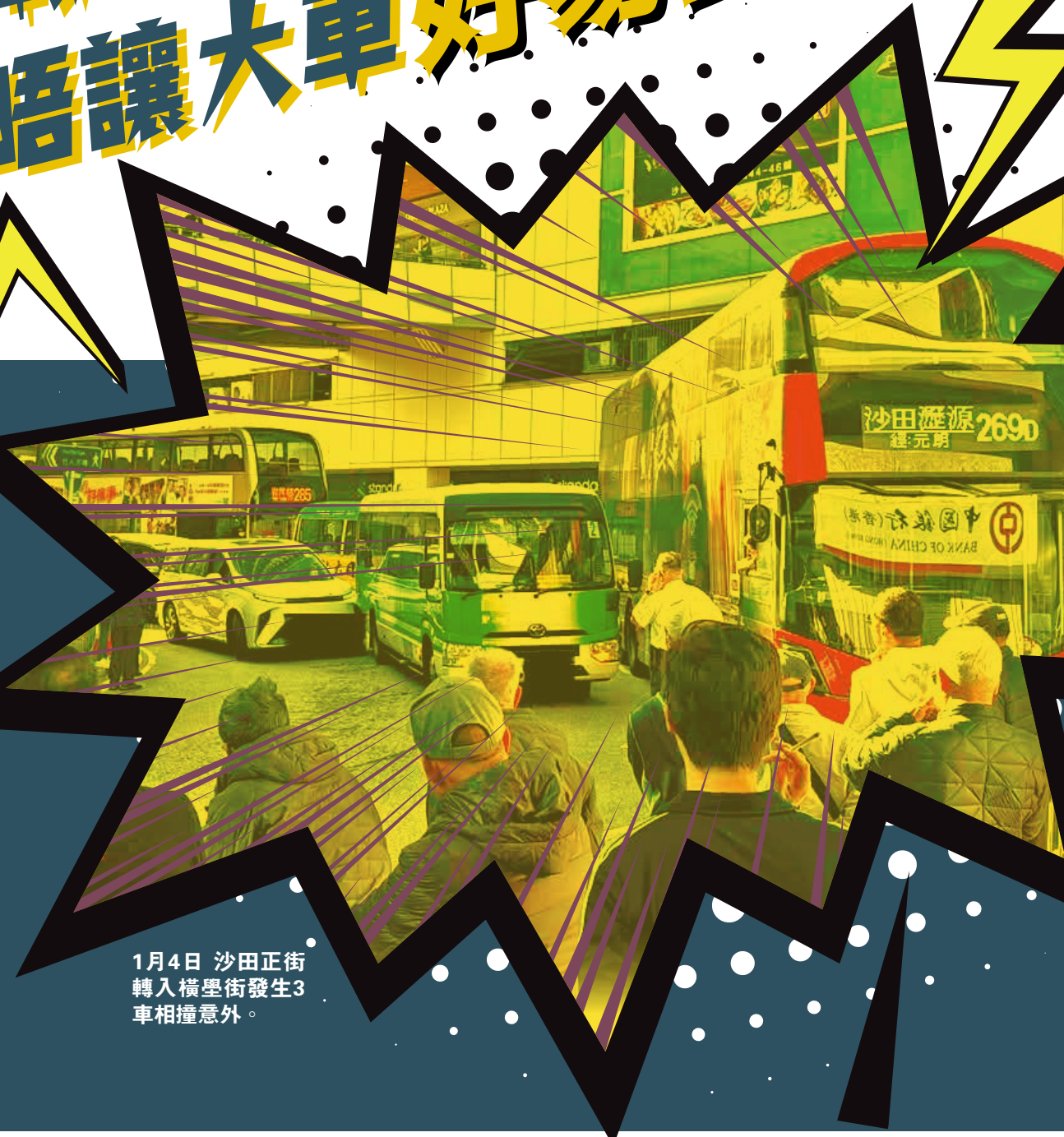
1月4日 沙田正街轉入橫壘街發生3車相撞意外。

沙田正街轉入橫壘街的彎位是區內知名的交通意外黑點，屢生事故很大程度源於該處三線同時右轉。常有車輛因未留意到大車需要「偷位」轉彎而同時轉彎，導致碰撞，再加上橫壘街不時有車輛違泊，令情況更為嚴峻。今年初短短11日內就先後發生兩宗交通意外，令沙田市中心交通屢屢受阻，引起地區人士高度關注，並與相關部門商討改善良策。