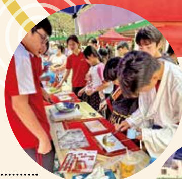
由校園走入社區，學生努力推廣文化。