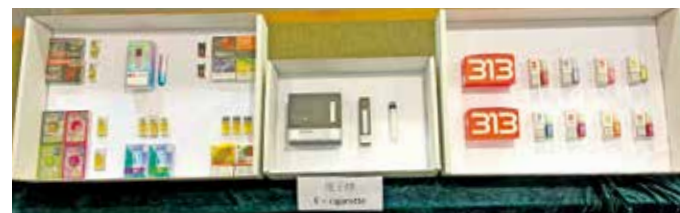
4月底起，公眾地方全面禁止管有另類吸煙產品。（資料圖片）