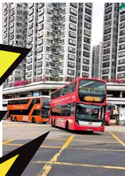
當日不時巴士要改道行駛，令沙田市中心車流增加。