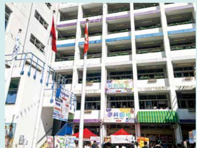
展藝開放日，學生都有發揮機會。

除了課程設計，學校亦投放資源提升學習環境。今年更撥款約160萬元，在全校31班課室加設兩部智能電視，有機會成為馬鞍山首間「雙Smart TV」小學，提升課堂互動。