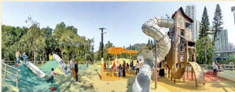
將軍澳寶翠公園兒童遊樂場已改造完成。

16個項目已完成公共遊樂空間計劃的公園，分布本港各區，惟荃灣區、九龍城區、中西區、離島區和大埔區則一個都未完成。《我家》記者到位於將軍澳寶翠公園兒童遊樂場察看，改造後設有不少新式玩樂設施，包括樹屋、飛天滑索、山丘滑梯、共融氹氹轉等，吸引不少小孩到場遊玩，而不少設施都有貼上標示。