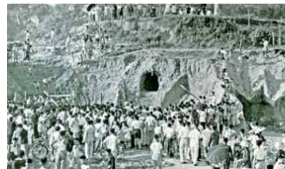
1955年發現漢墓引起社會關注。（歷史圖片）