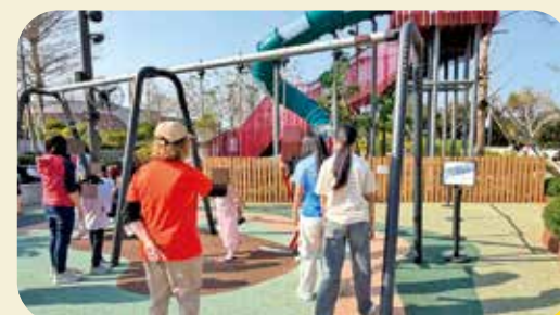
有八、九歲的兒童在鞦韆上攀爬，被工作人員喝止。