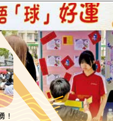
學生有不同崗位，包括攤位揸fit人。