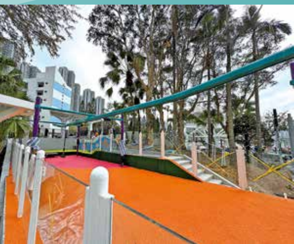
公園設有甚受兒童歡迎的飛索設施。