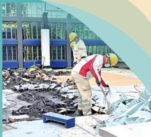
籃球訓練場地地面已在加緊重鋪。