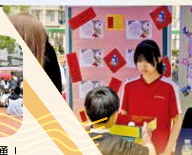
學生有不同崗位，包括攤位揸fit人。