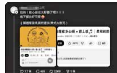
Threads上的「請慎選你聽的音樂，有的無形眾生很聰明又厲害，會利用流行元素去控制人心，進行奪取與控制，吸取人類的能量」