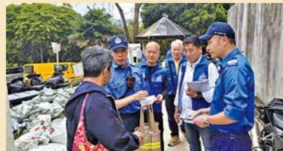
團隊火警後到鄉村宣傳進行防火。