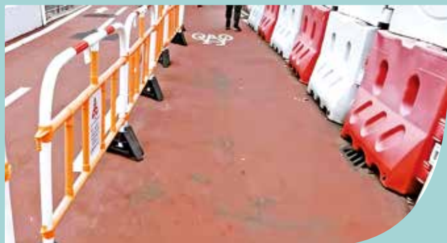
工程期間道路變窄，單車與行人共用臨時通道。

根據路政署去年提交荃灣區議會的文件，擬議的荃灣路擴闊及相關路口改善工程已於2023年8月刊憲。計劃將現有雙線或三線分隔車道，擴建成雙程五線分隔行車道，以紓緩荃青交匯處及連接葵涌道的交通瓶頸。目前工程顧問仍正進行勘查研究，尚未訂出具體動工日期。