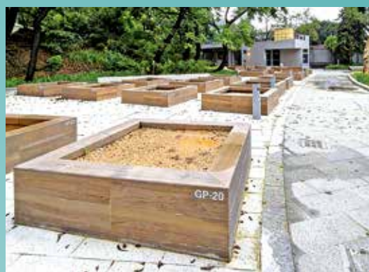
公園內的園圃早於去年九月開放。