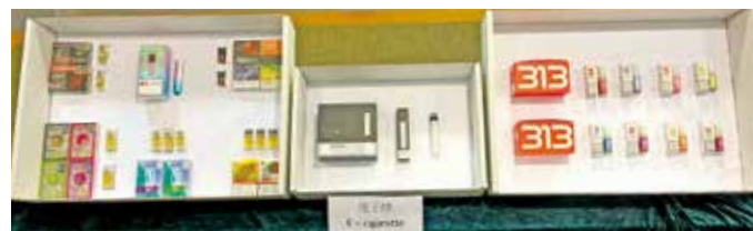
4月底起，公眾地方全面禁止管有另類吸煙產品。（資料圖片）