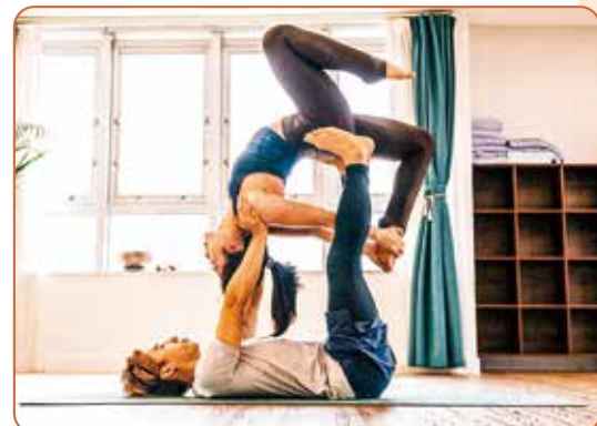
在荃灣的小小瑜伽室，讓人放下忙碌。