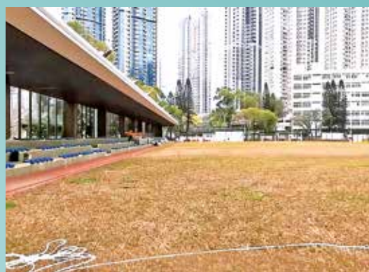
球場已更換地下灌溉系統及重鋪草地。