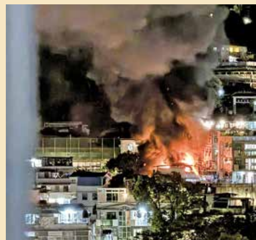
荃灣老圍村3月19日晚上發生火警。

到了火災翌日，該隊亦立即聯同消防處、荃灣民政處及荃灣防火委員會，走入鄉村開展防火宣傳教育活動。現場講解防火知識、示範逃生技巧，並派發實用防火小禮物，加強居民的防火意識，期望攜手守護社區安全。