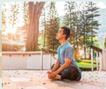
一呼一吸，學與壓力共處，找回內在平靜。