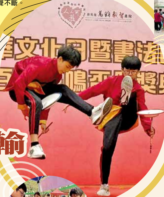
台上表演雜耍，台下喝彩聲不斷。

漫畫家、從事多年漫畫及圖書繪本工作，作品有：《數碼暴龍》、《妖怪總動員》、《動夢成真》（中學電影動畫藝術教材—香港生產力促進局製作）、《大偵探福爾摩斯》、《衛斯理系列少年版》、《神探包青天》、《我的吸血鬼同學》、《妙探鬼靈精》、《UBL宇宙當入樽》。