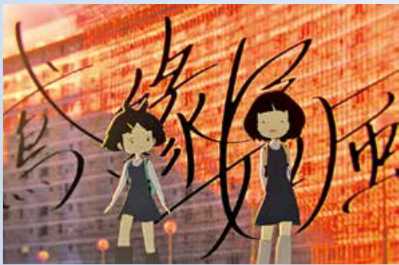
成長於公共屋邨的記憶，一筆一筆放進動畫《寫緣如風》。