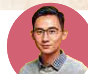
作者： 陳洛志 醫師