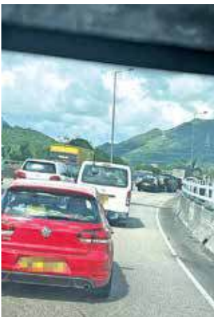
新路開通後有助紓緩北區交通壓力。