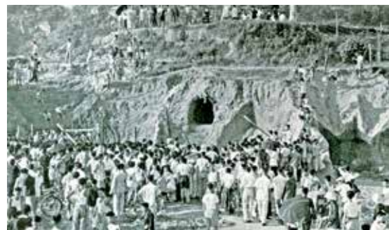
1955年發現漢墓引起社會關注。(歷史圖片)