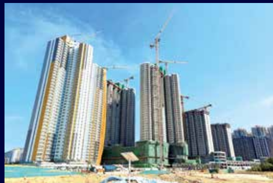
粉嶺北新發展區首個公屋鳳凰嶺邨正在興建。