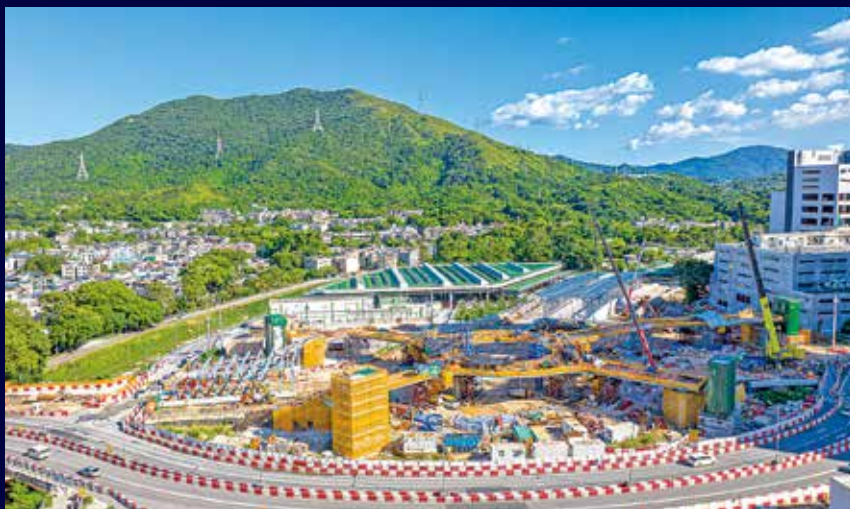
繞道新建龍躍頭交匯處接駁沙頭角公路。