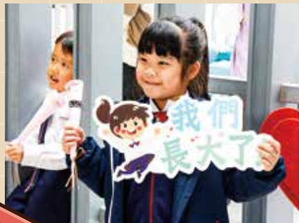
來到皇后山第三個年頭，陳校長一直陪住這個新社區慢慢長大。