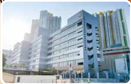
學校隨着皇后山邨、山麗苑發展而成立。