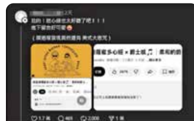
Threads上的「禪修多心經·居士版」：這視頻請慎選你聽的音樂，有的無形眾生很聰明又厲害，會利用流行元素去控制人心，進行奪取與控制，吸取人類的能量。 www.threads.com