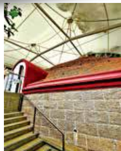
古墓於2005年加設帳篷上蓋作保護。