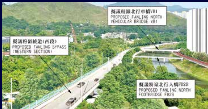
粉嶺繞道（西段）料最遲2031年通車。