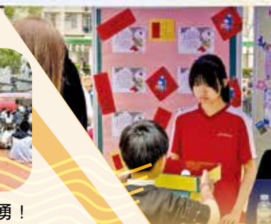
學生有不同崗位，包括攤位揸fit人。