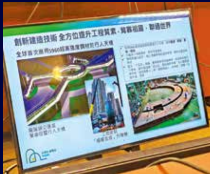
龍躍頭圓環行人天橋，採用國產超高強度鋼材建造。

全長約4公里、連接粉嶺公路與粉嶺北新發展區的粉嶺繞道（東段）工程進入尾聲，4月底至5月初全面開通。為配合工程進度，龍躍頭交匯處的南行線已率先於3月底已開放予公眾使用。有地區人士認為，作為北部都會區首個落成的大型運輸基建項目。此繞道的啟用將有效分流區內交通，為居民節省約10分鐘的行車時間。