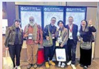
兩人希望透過創作與展示，讓大家知道香港有人做動畫。