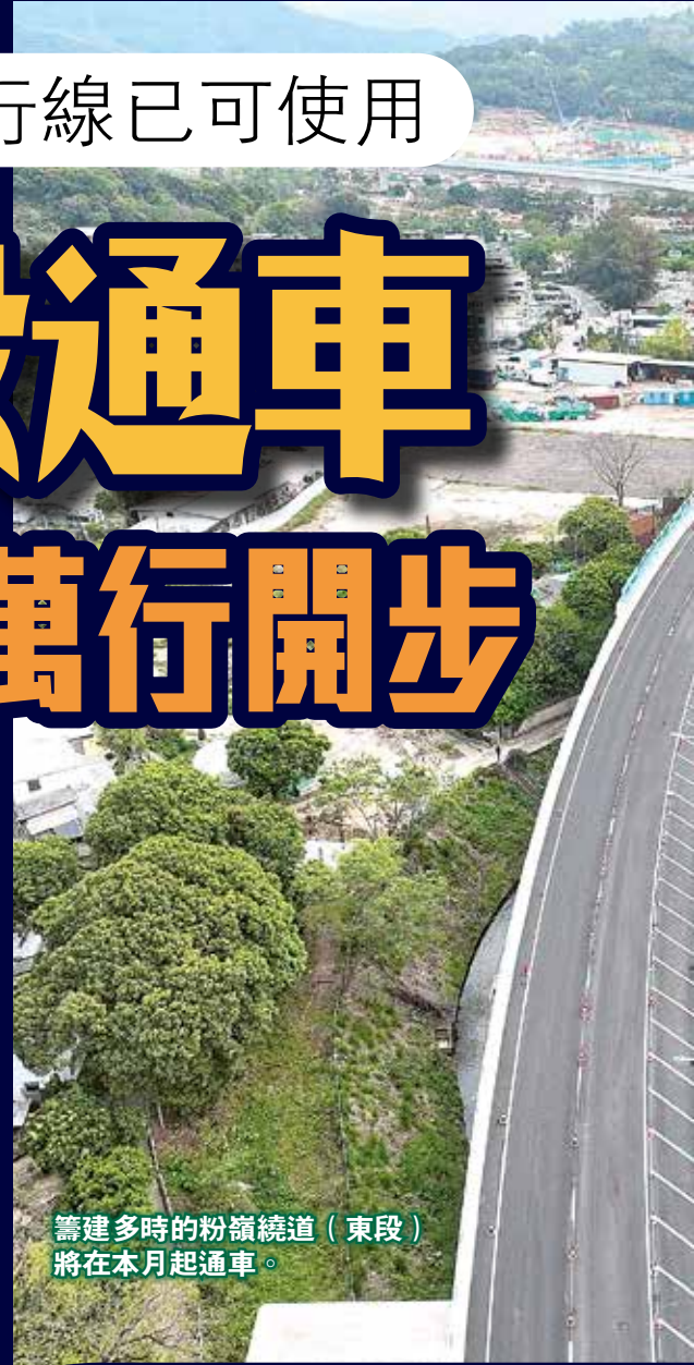
籌建多時的粉嶺繞道（東段）將在本月起通車。